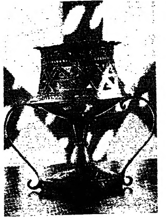
الدخان نبعث من محرقة البخور

سلطنة عمان أسرة كبيرة بين إبنائها فروع ومميزات مستقلة من ناحية المظهر، ولكنهم جميعا في جوهرهم يمثلون أسرة كبيرة متجانسة تسكن في بيت كبير مكون من ست غرف متداخلة: ولندا من الفرقة الجنوبية حيث سكان ظفار الذين ينتمي بعضهم الى الجنس الحامسي والبعض الآخر الى الجنس السامي، ولهم صلات قوية بسكان جنوب الجزيرة العربية الذين يعرفون باسم الشحوح وهم يعيشون في شبه جزيرة